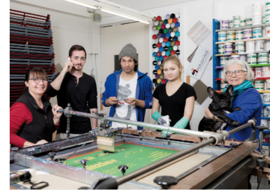
Personal © 2016 Fotowerder

Bei Fahrzeugbeschriftungen fahren Sie gut mit uns. Wir verwandeln Ihr Fahrzeug in einen kostengünstigen Werbeträger. So ist Ihre Werbung immer präsent und mobil. Der Phantasie sind keine Grenzen gesetzt. Dank unserer langjährigen Erfahrung können wir Sie kompetent beraten und Ihr Design optimal umsetzen. Gerne erwarten wir Ihren Besuch in unserem Atelier.